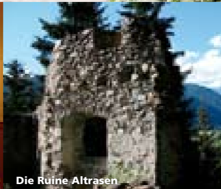
Die Ruine Altrasen